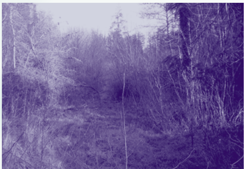
Coilltearnach measctha oiriúnach chun gnáthóige don gcat crainn

Maireann sé de ghnáth faoi scáth coille, bíodh búircíneach nó measctha nó ina scrobarnach. Fós áfach, tagtar air ar thalamh chairrgeach oscailte, cosúil leis