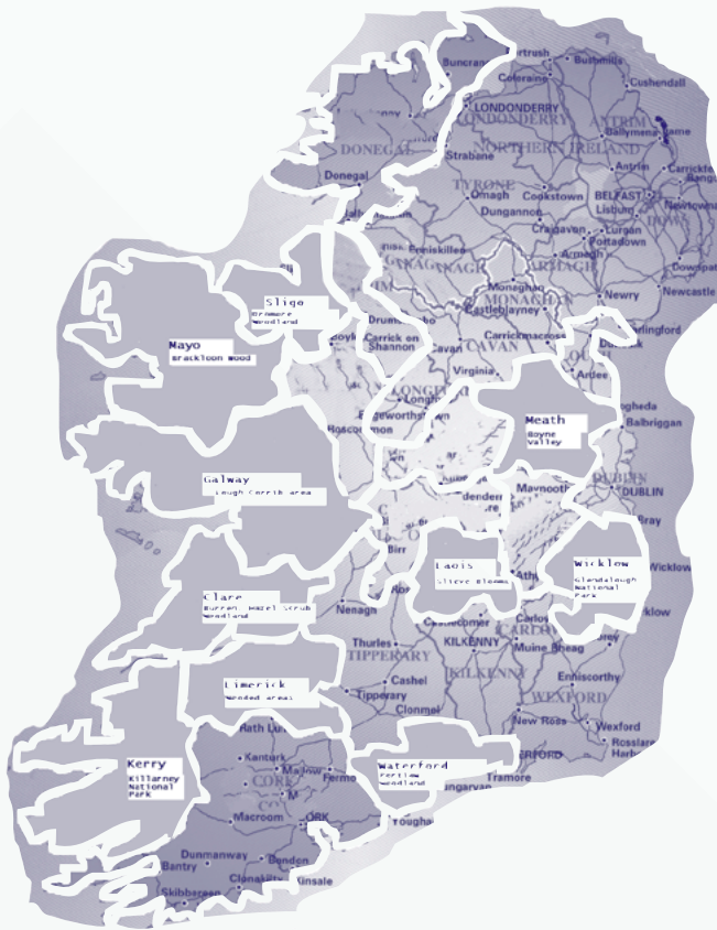
Cuntas an Dáilscaipithe

gach aird den tír. Faoi láthair níl ach 9% d’Éirinn faoi chrainn; sin é an t-áireamh is lú san Eoraip. Sa gú céad déag deintí an cat crainn a sheilg ar mhaithe lena sheiche (fionnriaidh). Ní bhíonn ag an gcat crainn ach áil beag, agus ní thagann siad in innmhe siolraithe go ceann a trí de bhlianaibh. Nuair a húsáidte conablach nimhiúil (faoi stricín) d’fhonn sionnaigh d’idiú, mhéadaigh sin ar ráta éaga an chait chrainn. San am i láthair is óspairtí bóthair is mó a dhíscionn an cat crainn agus an fiadhúil i gcoitinne.