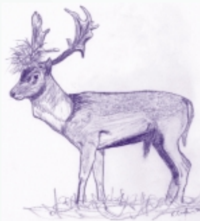
Carria Búí i gcaitheamh shéasúr an rachmaill, díreach tar éis féar fada a ghreadadh lena bheanna

Fia meánmhéide, nach ó Éirinn ó dhúchas dó. Thug na Normanaigh fianna buí isteach go hÉireann in 1244 ó Shasana go dtí Gleann Crí i gContae Chill Mhantáin. Tugtar carriana ar fhianna fireanna, eilití ar fhianna baineanna agus oisíní ar a sliocht.