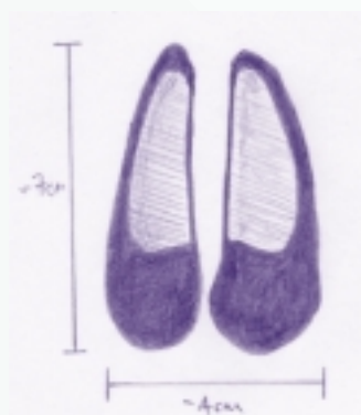
Rian Fia Búí 7cm ar a fhad x 4cm ar leithead (cruth = péire slipéirí fada)

Bíonn dath bán ar phaiste an phrompa, imeall dubh timpeall air agus é ar dhéanamh croí.