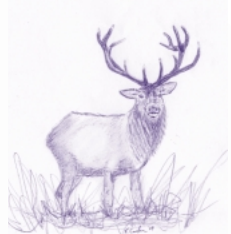
Carria Rua i gcaitheamh shéasúir an rachmail

Bíonn dath trom donnrua ar an bhfionnadh i gcaitheamh mhíonna an tsamhraidh, ach maolaíonn an dath go mbíonn sé donn sa gheimhreadh. Bíonn dath an uachtair ar an mbolg agus is féidir baill éadroma béis ( beige ) a fheiceáil feadh na gcliathán. Bíonn dath an uachtair-béis ar phaiste an phrompa agus téann sé suas amach ar dhroim an fhia, os cionn eireabaill a bhíonn